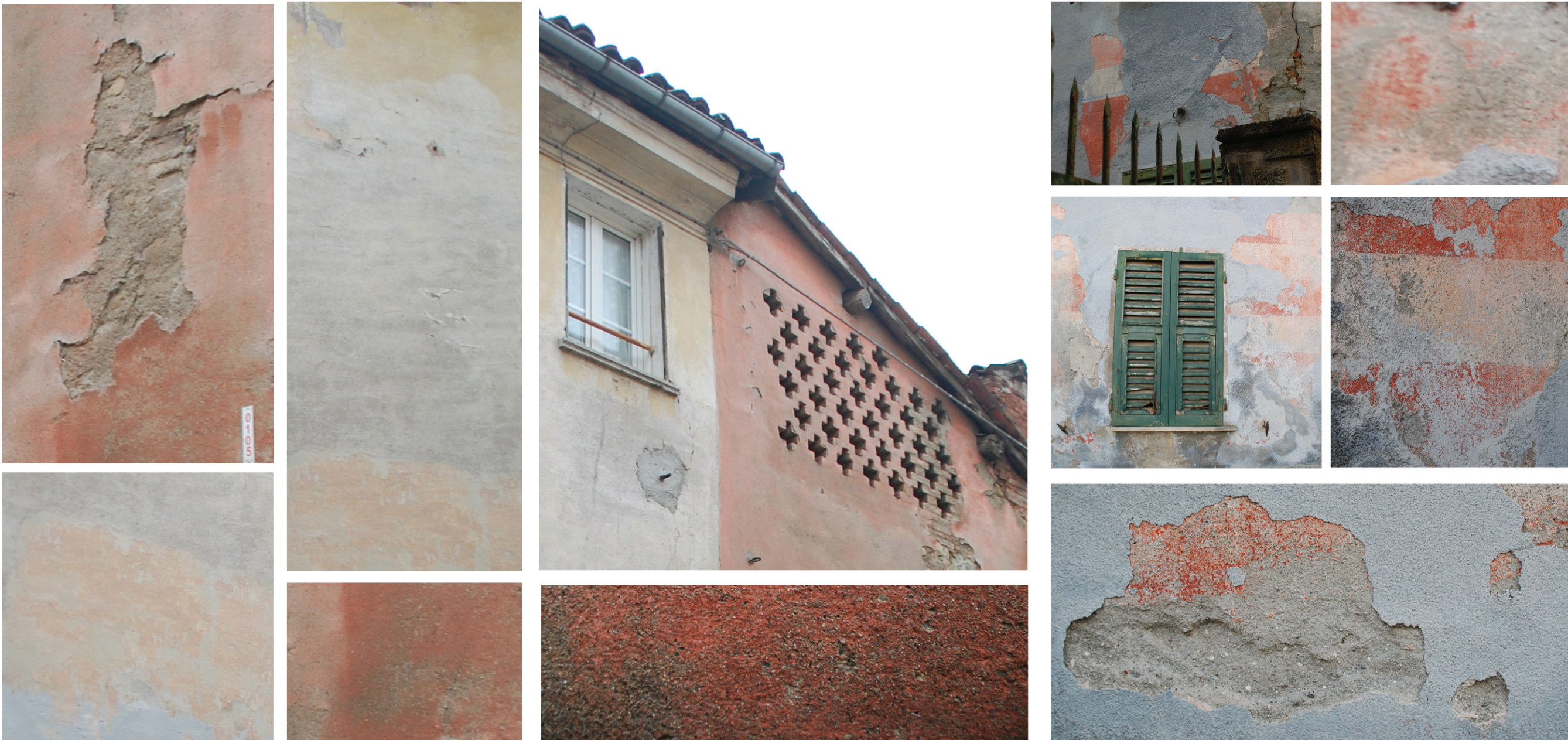
Analisi delle facciate - edifici mapp. 393-396-399

Come si evince dalla campagna fotografica, le facciate relative agli immobili sopra indicati che compongono parte del prospetto di Via Nigra versano in pessimo stato di conservazione, con comprovati distaccamenti di porzioni di intonaco e dei successivi strati di pittura che permettono di evincere la gamma cromatica originaria. Attraverso il rilievo con mazzette sono state definite tinte il più possibile vicino a quello che doveva essere l'aspetto cromatico iniziale del fronte, tenendo in considerazione l'ambiente nel suo complesso.